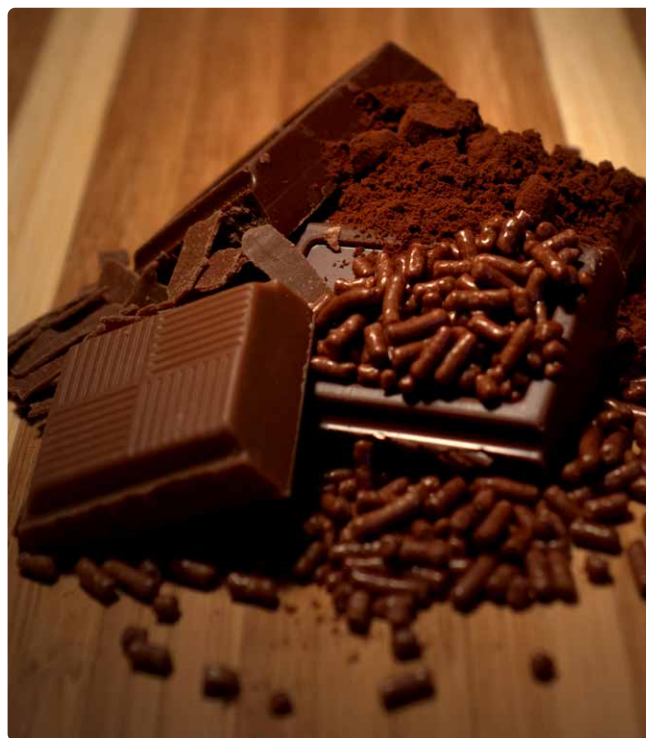
Man sieht es der Schokolade nicht an, aber der Kakao dafür wird häufig mit hochgefährlichen Pestiziden besprüht.

Vor dem Hintergrund der strukturellen Armut, in der die meisten Kakaobäuer*innen leben, sind sie besonders anfällig für die schädlichen Auswirkungen hochgefährlicher Pestizide. Ihre Einkommen sind häufig so gering, dass sie sich die notwendige Schutzausrüstung wie Handschuhe, Brillen oder Stiefel nicht leisten können. Die im Kakaoanbau eingesetzten Wirkstoffe können sowohl akute Vergiftungen als auch chronische gesundheitliche Folgen verursachen. Ohne ausreichende Schutzausrüstung sind die Kakaobäuer*innen diesen Risiken direkt ausgesetzt. Diese Wirkstoffe sind darüber hinaus auch für Menschen, die in der Umgebung von Kakao-plantagen leben, gefährlich.