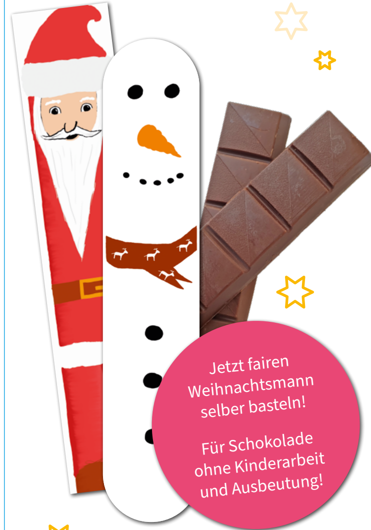
Illustration Weihnachtsmann/Schneemann: Simon KH, gedruckt auf 100 Prozent Recyclingpapier

Jetzt fairen Weihnachtsmann selber basteln!